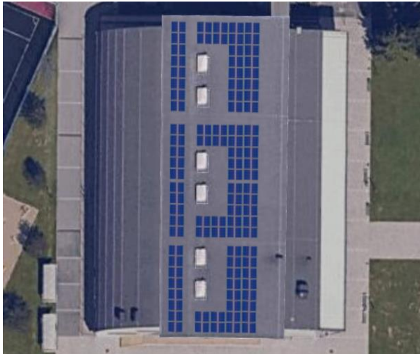
Slika 1: Lokacija postavitve FVE – ŠD Duplek (športna dvorana Osnovne šole Duplek)

Fotonapetostni generator je nameščen na strehi objekta na parc. št. 839/8, k.o. 692 - Spodnji Duplek .